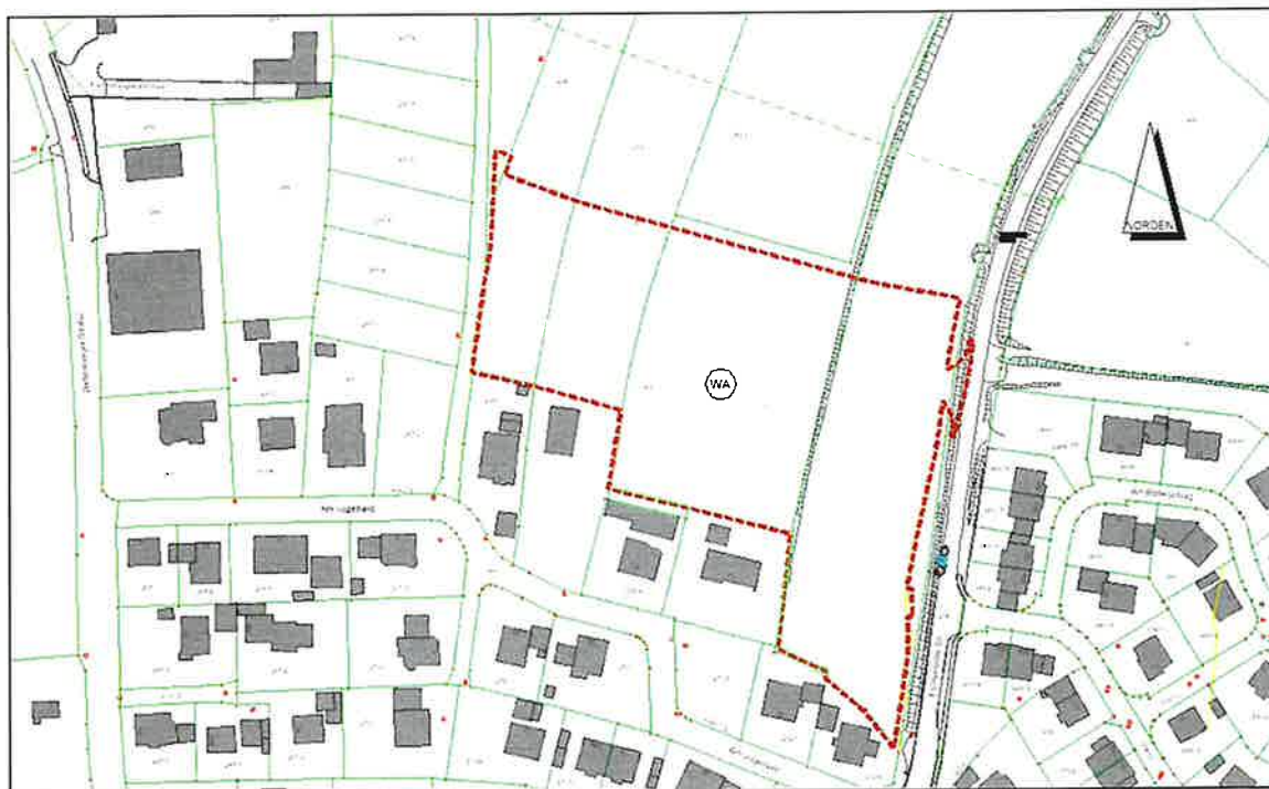
Abb. 2: Geltungsbereich im Liegenschaftskataster (Stand 2024)

Der Geltungsbereich umfasst derzeit Grünland und landwirtschaftliche Flächen mit einer Größe von ca. 14468 m 2 .